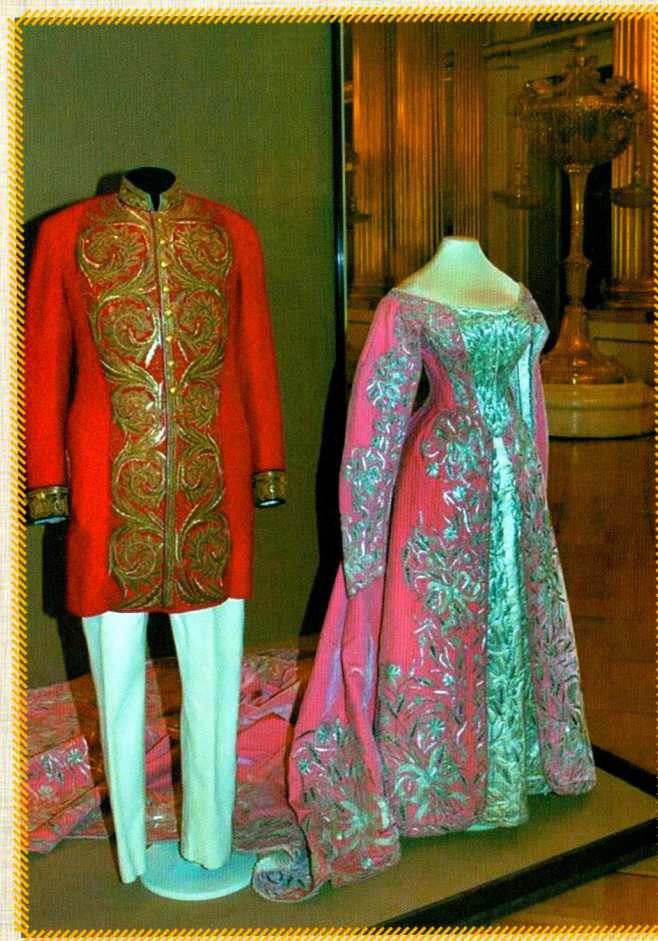
Парадные наряды, XIX в. Государственный Эрмитаж

кий Устюг, Сольвычегодск, Владимир, Кинешма, Торопец, Арзамас и другие города. Также головные уборы, платки и другие части народного костюма вышивались в мастерских местных женских монастырей. Такие монастыри были повсюду и в мелких городах и сельской местности. Мастерицы