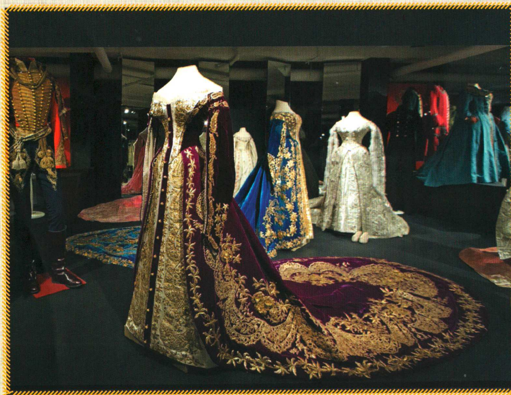
Коллекция костюмов XVIII и XIX в.в., Государственный Эрмитаж

довольно большое внимание. Новицкая М.А. считает, что вышивки выполняли разные мастерицы, «...отличающиеся различной степенью наблюдательности и различным уровнем золотошвейного мастерства. Это видно и в различном выполнении стежков: то мелких и плотно прилегающих один к другому, то более длинных и редко расставленных». М.А. Орлова называет орнамент «почерком