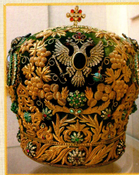
Митра (головной убор у высших духовных лиц)