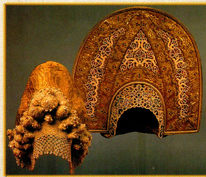
Русские кокошники, XVIII в.

Орнаментальные украшения в декоративно-прикладном творчестве являлись и знаками, помогающими определить социальное и общественное положение человека. Сохраняя ярко выраженный национальный характер эти особенности, не только характеризуют народное искусство, но представляют богатейшее орнаментальное наследие. В современной науке изучению орнамента уделено довольно большое внимание. М.А. Орлова называет его “почерком эпохи”, “формально сжатым, наиболее точным и отчетливым выражением того или иного стиля”. Орнаментальные мотивы использовали как на светских вещах, так и на предметах церковного назначения. Даже лицевые