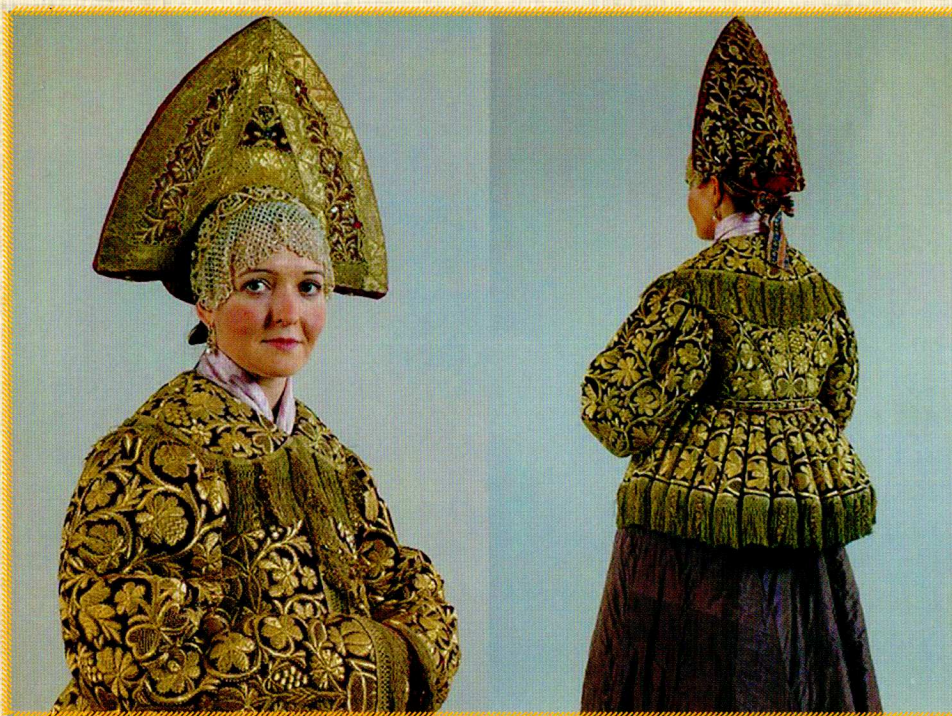
Русский традиционный праздничный наряд, XVIII в.

В XVII-XVIII веках большое развитие получило сложное, изысканное шитье на придворных парадных костюмах. Британского посла сэра Чарльза Хенбери-Уильямса, прибывшего в 1755 году в Россию, изумил русский двор. Знакомый с иностранными дворами, нигде он не видел такой роскоши. Хенбери-Уильямса поразило обилие серебряных кружев, золотой вышивки и наличие драгоценностей на нарядах придворных дам. Крупные заказы выполнялись в