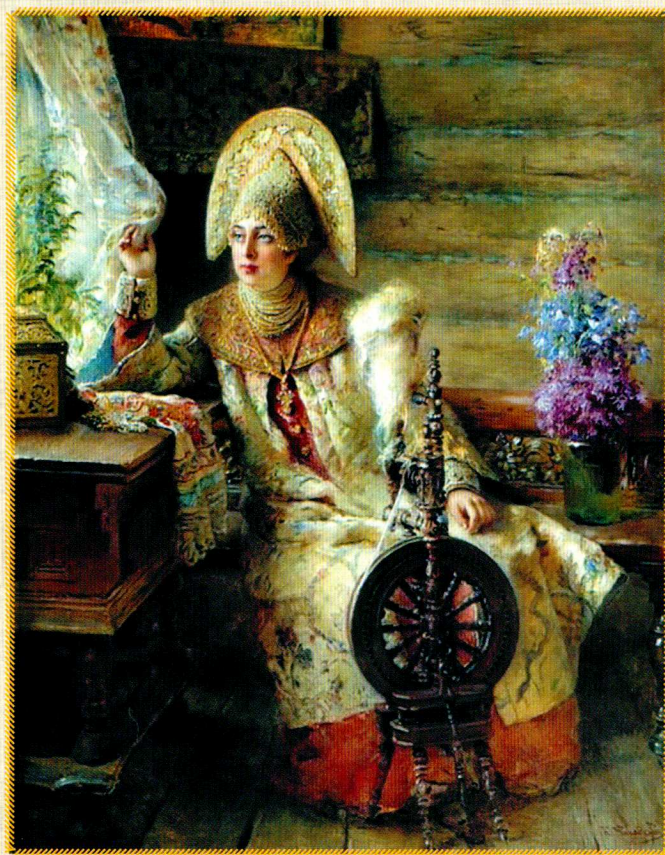
«Боярышня у окна», К. С. Маковский, 1890

развития промысла, но и обучиться древней технике «канительная вышивка» для применения в современном творчестве. Как показали исследования, уникальные коллекции традиционных произведений золотого шитья, хранящиеся в музейных фондах, монастырских ризницах, ведомственных и частных собраниях обладают большой историко-культурной, художественной ценностью и могут служить научно-исследовательской и методической базой для изучения, возрождения и популяризации золотого швейного промысла в Тюменской области. Данное пособие разработано для педагогов и студентов художественных учебных заведений, мастеров, работающих в области народного и декоративно-прикладного искусства, а также для специалистов индустрии моды, туризма и дизайна.