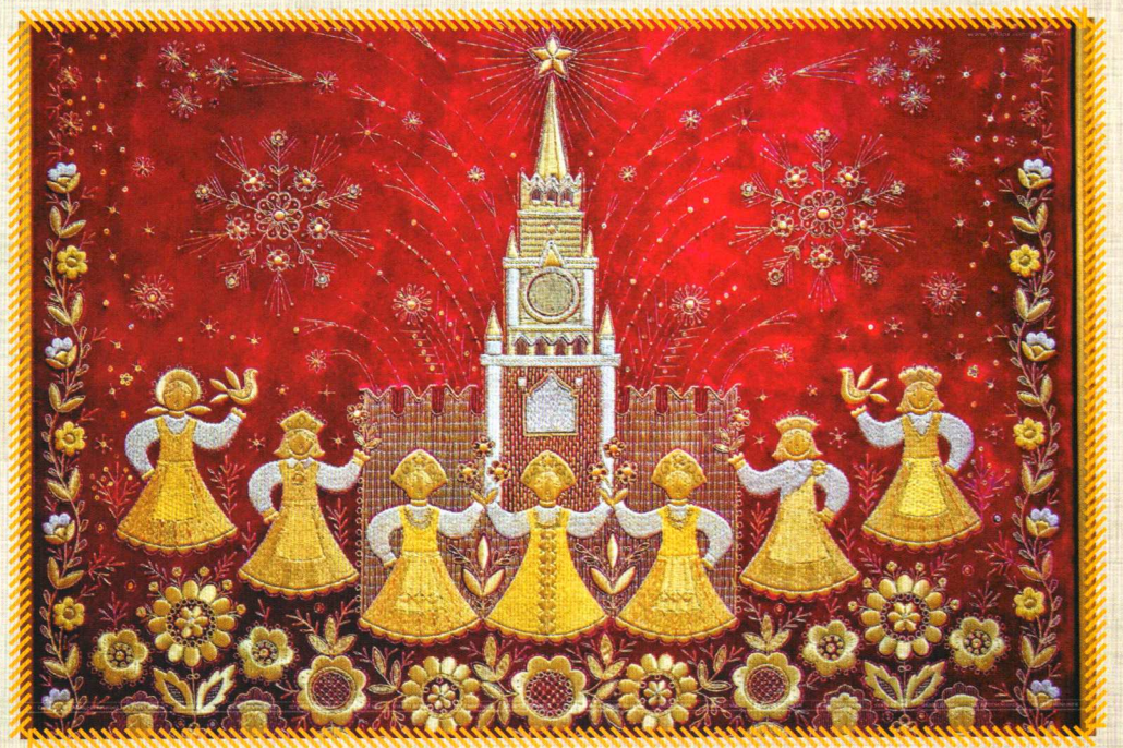
Панно декоративное. Торжокская золотошвейная фабрика, XX в.

вознаграждение. Русская золотая вышивка прошла сложный и своеобразный путь развития. Отличием является то, что шитьё металлическими нитями ярко бытовало в различных слоях общества. В создании драгоценной вышивки для светской и духовной знати принимали участие самые известные художники своего времени. Творческое содружество художников и мастериц из народа способствовало развитию самобытного вида русского золотошвейного искусства, стоящего на одном уровне с икописью, фреской и ювелирным ремеслом.