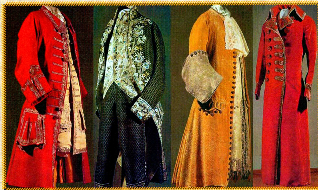
Гардероб Петра I, XVII в. Государственный Эрмитаж

применяются золотые и серебряные нити, усложняются техники шитья, используются жемчуг и драгоценные камни. Вследствие чего, многие произведения шитья воспринимаются уже не как живописные полотна, а как декоративные и драгоценные вещи.