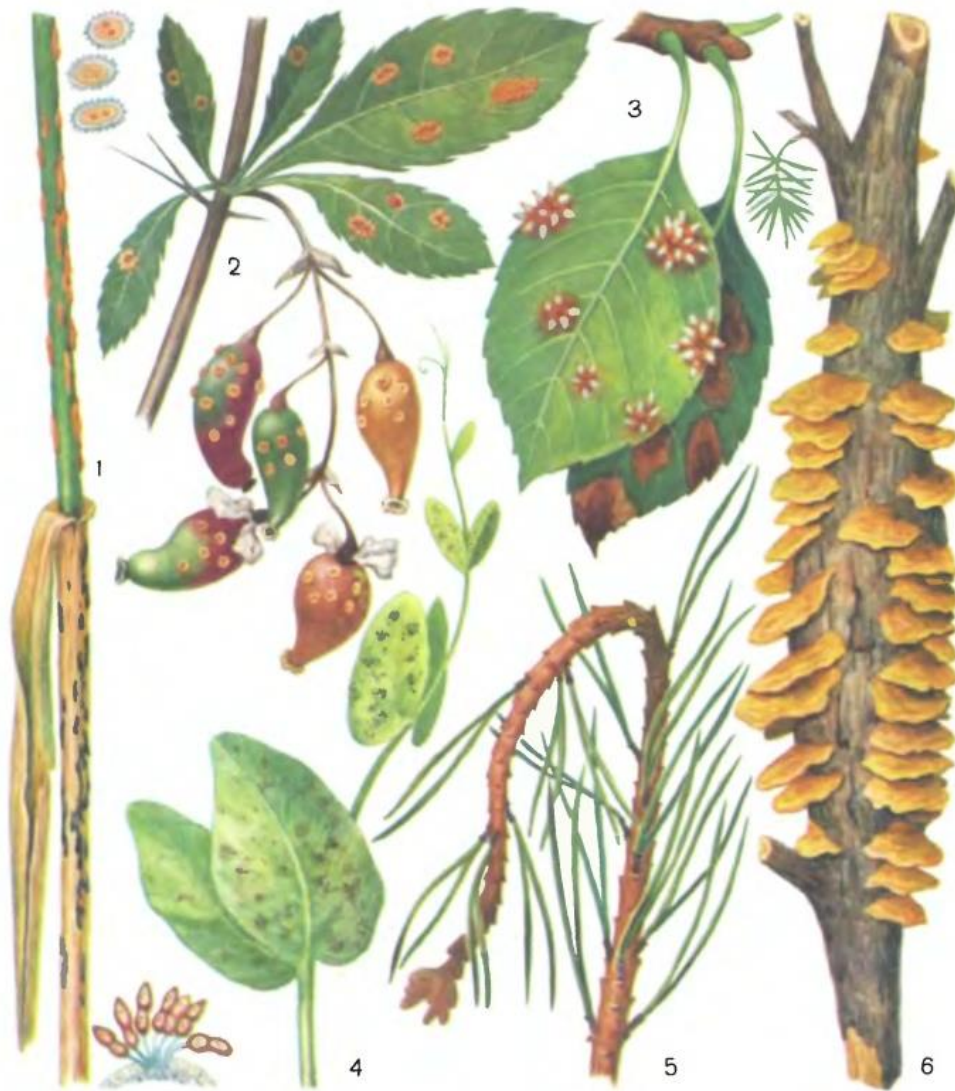
Таблица 54. Ржавчинные грибы:

1 — стеблевая ржавчина злаков (возбудитель — Russcinea graminis ), с п р а в а — уредо- и телейтоспороношение на стеблях пшеницы; 2 — эцидия стеблевой ржавчины на барбарисе; 3 — гимноспорангий ( Gymnosporangium tremelloides ) эцидии на листьях яблони; 4 — ржавчина гороха (возбудитель — Uromyces pisi ); 5 — поражение сосны вертуном (возбудитель — Melampsoga pinitorqua ); 6 — поражение можжевельника (возбудитель — Gymnosporangium juniperinum ).